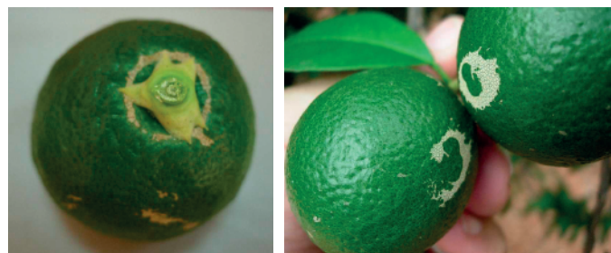
Daños provocados por las larvas alrededor del cáliz y en la zona de contacto entre dos frutos

Productos: abamectina , aceite de parafina 79%, clofentezín , etoxazol , fenpiroximato , hexitiazox , piridaben , spirodiclofen , tebufenpirad