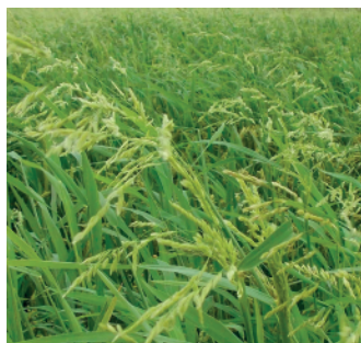
Panícula de Leersia sobresaliendo del arroz