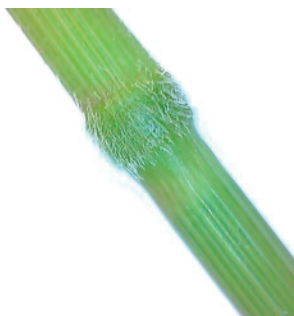
Pilosidad característica del nudo

Tallos de hasta 1 metro de altura, con hojas lineales de color verde claro con el nervio central blanco. Son muy ásperas al tacto, lo que es una forma de distinguirlas. Presenta una lígula membranosa, corta y truncada. Los nudos están rodeados por una pilosidad muy característica que las diferencia de las Echinochloas . Los nudos además son capaces de emitir raíces. Inflorescencia en forma de panícula piramidal alargada de hasta 20 cm de longitud, laxa y sistema radicular rizomatoso.