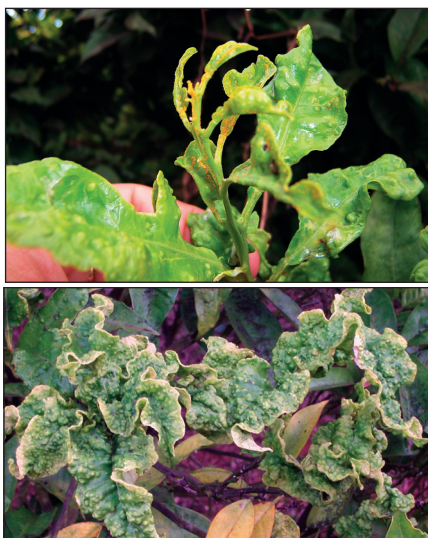
Figura 2.- Brote con abundante puesta (en color anaranjado) de T. erythrae .