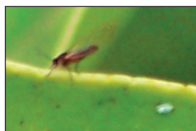
Figura 1.- Adulto de T. erythrae mostrando la característica disposición del abdomen sobre el sustrato.

Los adultos de esta especie miden unos 4 mm de longitud, son de color oscuro, alados y, cuando se están alimentando forman con su abdomen un ángulo de unos 35° con el sustrato (Figura 1). Son buenos voladores y saltan cuando se les molesta. Los huevos son de color anaranjado y se localizan exclusivamente en los brotes en crecimiento, donde pueden aparecer en grandes cantidades tanto en los márgenes como en los nervios centrales de las hojas (Figura 2). Presentan un extremo puntiagudo con el que se insertan en el tejido foliar. Las ninfas son ovaladas, planas y su color puede variar desde amarillento hasta gris oscuro pasando por distintos tonos verdosos y están ribeteadas por secreciones cerasas. Son muy poco móviles y se localizan en las deformaciones que ellas mismas producen en las hojas (Figuras 3 y 4) y que acaban deformando el brote (Figura 5).