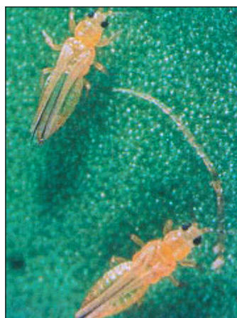
Figura 1.- Adultos de S. citri .