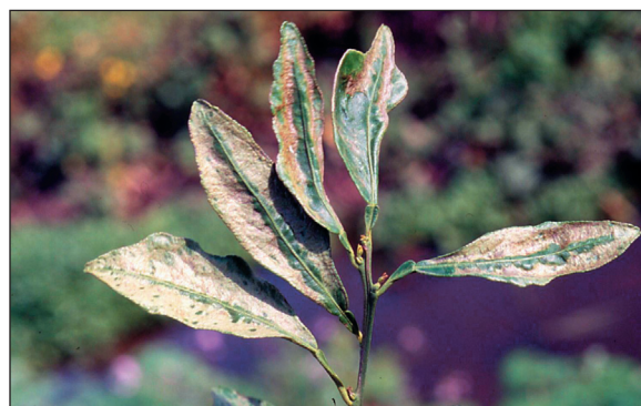
Figura 3. y 4.- - Daños producidos por S. citri en hojas de cítrico. El síntoma en fruto son cicatrices parecidas a las que se observan en estas dos figuras..