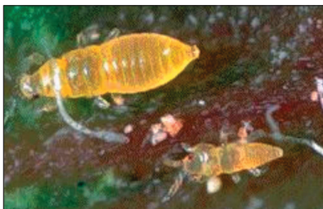
Figura 2.- Ninfas de S. citri .